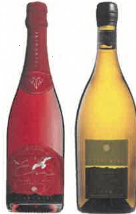
スパークリングワイン シャルドネ キャンベル・アーリー アンフィルタード

標高600mの寒暖差の激しいこの地と美味しい水が、絶妙な糖度と酸味のブドウを産む。五ヶ瀬ワインは、地元産のブドウを100%使用。みずみずしさが溢れ、フルーティーに仕上がっている。阿蘇の山々に沈む夕日を眺めながら、じっくりと味わいたい。