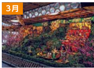
桃の節句を祝う伝統の雛山(綾町)