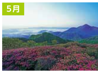
大幡山のミヤマキリシマ(小林市)