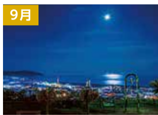
愛宕山笠沙の御崎公園からの夜景(延岡市) ※一般社団法人愛媛観光コンベンションビューローから「日本夜景遺産(2004)」、日本百名山(2020)に認定されています。