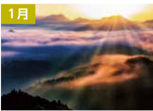
高千穂・国見ヶ丘の日の出(高千穂町)

価格 1,000円 (税込) 化粧箱付き サイズ / 535mm x 380mm ※送料は別途負担となります。