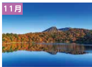
六観音御池の紅葉(えびの市)