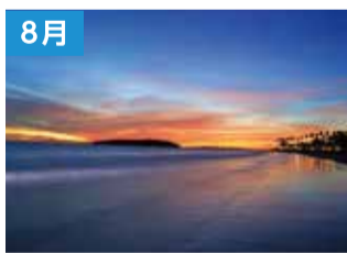
青島海岸の朝焼け(宮崎市)