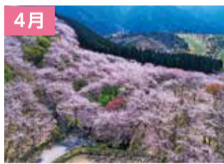
花立公園の桜(日南市)