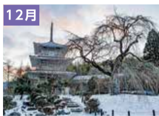
春待つ浄専寺のしだれ桜(五ヶ瀬町)