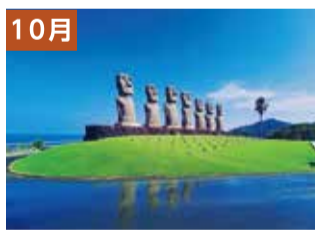
日南海岸・雨上がりのモアイ像(日南市)