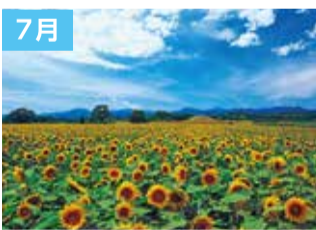
西都原古墳群のひまわり(西都市)