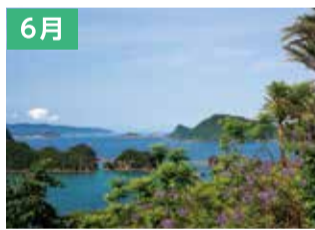
日南海岸のジャカランダ(日南市)