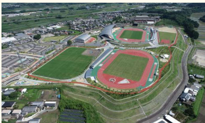
(写真はすべてイメージ)

観光地をめぐりながらお掃除をしたり、地域の文化を学びながら植樹をしたり、環境美化や、人と人との交流を通じて、そこに関わる全ての方々とともに「地域を元気に、人を笑顔に。」していきたいと考えています。