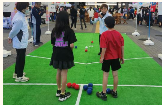
(写真はすべてイメージ)