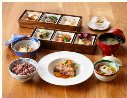
ご昼食：霧島うまいもの膳(※イメージ)