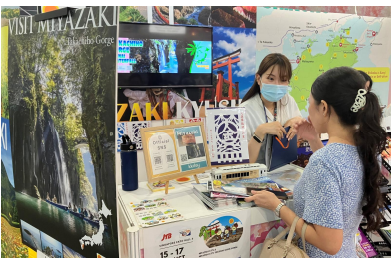
（上）会場全景と（下）本県ブースでの様子