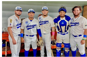
ニカラグアWBC代表チーム（2/11～2/19） 大王谷運動公園野球場（日向市）