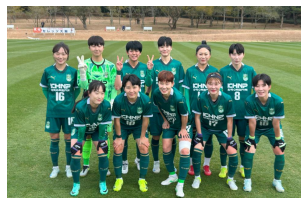
韓国女子サッカー（キョンジュ ハンスウォン） （2/10～2/15） 宮崎市生目の杜運動公園陸上競技場（宮崎市）