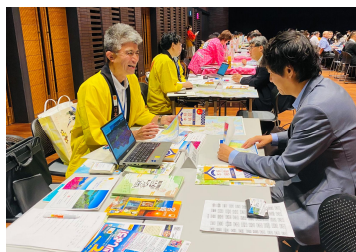
（上）商談の様子と会場全景（下・福岡会場）

この事業は来年度のツアー造成をするにあたり、JTB・阪急交通社の大手旅行会社をはじめとした各社造成担当者と九州