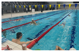
【海外チーム合宿等】 競泳韓国代表チーム（4/14～5/22） パーソナルアクアパーク宮崎（宮崎市）

【利用期間】2月28日まで 【利用料金】1日2,000円（税込） 【貸出・返却場所】宮崎空港1階到着ロビー 手ぶら観光サービス 【貸出・返却受付時間】8:00～18:30 【申込方法】宮崎県公式観光サイト「みやざき観光ナビ」、 「WEB専用サイト」からお申し込みができます。